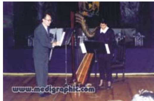
Concertistas de la Escuela Superior de Música que amenizaron la reunión.