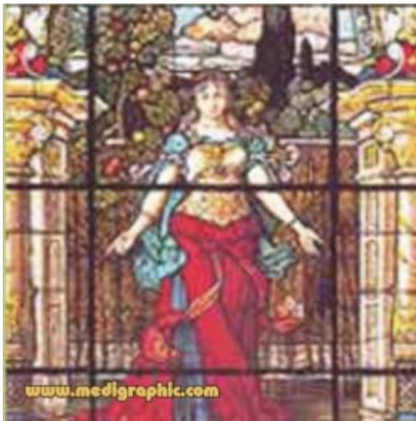
Figura 3. Vitral emplomado de la sabiduría... la bienvenida, que al pie de ella dice: amor, orden y progreso; para quien esto escribe eso representa la Dra. Romero.

nando Leal, dedicados a la vida del caudillo; también se encuentra "La Creación" de Diego Rivera, obra que marcó el inicio del Movimiento Muralista Mexicano.