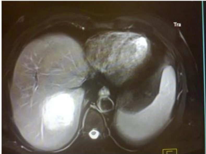
Fig. 4. RMN (T2). Muestra imagen hiperintensa redondeada bien definida.

Resonancia Magnética nuclear (RMN) de abdomen: Hígado: lesión solitaria hipointensa en el centro con cambios de intensidad de señal en la periferia, localizada en la región subdiafragmática, el tejido hepático que rodea la lesión esta difusamente hiperintenso, secundario a los cambios inflamatorios. Secuencia T2 de la lesión muestra hiperintensidad central de los componentes. El resto de los órganos no muestra anomalías, no se observan ganglios linfáticos y la grasa perivisceral es normal. Conclusión: absceso hepático. (Figura 4).