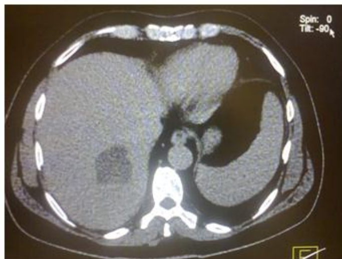
Fig. 3. TAC simple de abdomen (vista axial ), muestra imagen hipodensa, redondeada de contornos lobulados bien definidos.

Tomografía Axial Computarizada (TAC) contrastada de abdomen de abdomen. Informa hígado de tamaño normal, vasos preservados, con aumento de la ecogenicidad, visualizándose una imagen nodular de densidad compleja en el lóbulo derecho, en la cara posterior alta, cerca del diafragma, que mide 66 x 51 x 48 mm, vía biliar sin alteraciones. Se muestra realce discreto de contraste en la periferia de la imagen en la fase venosa. La densidad del resto de los órganos es normal, no se observa líquido libre en cavidad Conclusión: nódulo de densidad compleja en el lóbulo derecho del hígado, localizado en el segmento 7. Descartar absceso hepático. (Figura 3)