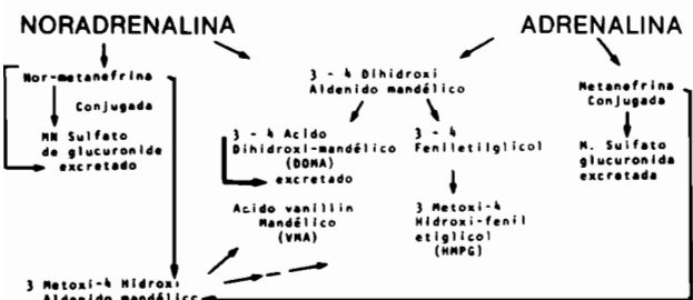
Figura 2. Catabolismo de catecolaminas

Datos clínicos. Los signos y síntomas que ocurren en el feocromocitoma son efectos ocasionados por el aumento de la cantidad de adrenalina y noradrenalina circulantes. Los más frecuentes y característicos son: