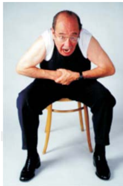
Figura 4. Inmediatamente se endereza el tronco, se separan los brazos y codos y se repite la compresión.