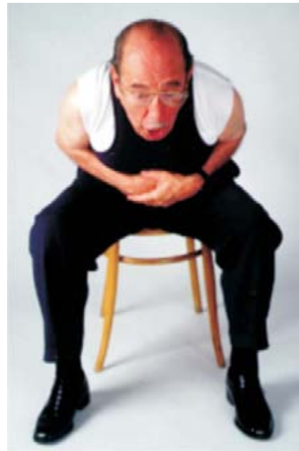
Figura 3. De inmediato, se inclina vigorosamente el tronco hacia adelante comprimiendo lo más fuerte posible con las manos el abdomen y al mismo tiempo el tórax con los codos y antebrazos, las caras laterales del tórax.

La automaniobra la efectúa de inmediato el propio afectado en la etapa más precoz, en estado consciente, lo que da una