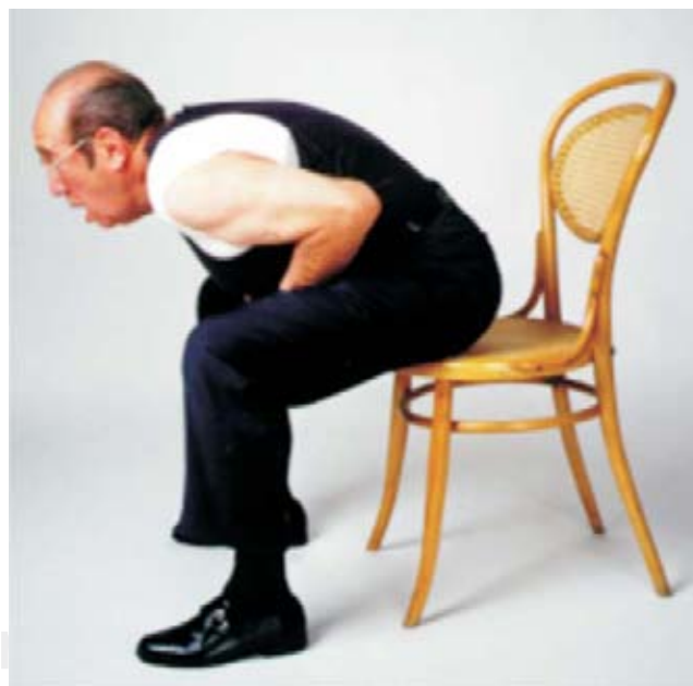
Figura 1. Al sentir la obstrucción, sentarse de inmediato, en la orilla del asiento, con las piernas separadas, inclinando hacia adelante, con la boca abierta. Sin pegar el mentón del pecho.