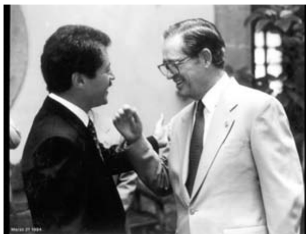
Con el licenciado Luis Donald Colosio

Por su destacada labor fue nombrado en 1973 asesor de Salud Mental de la Organización Mundial de la Salud y presidente de la Academia Nacional de Medicina.