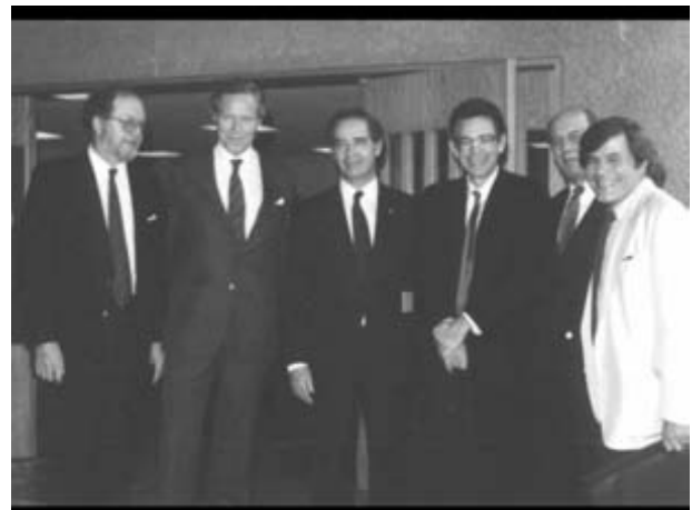
Con funcionarios de la WPA

"[...] El criterio fue que los problemas de la salud mental habrían de ser abordados desde un triple punto de vista: las neurociencias, las ciencias sociales y la clínica" [...] "Una tarea permanente fue y sigue siendo reclutar y adiestrar al personal en todos los niveles".