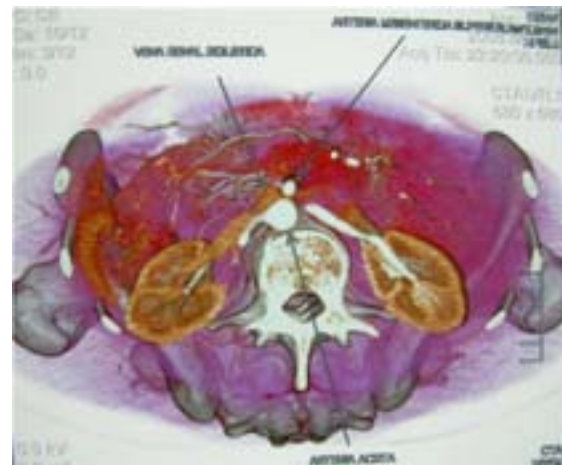
Imagen 4. La reconstrucción sagital y axil de la tomografía "multislice" permite valorar la compresión de la VRI.