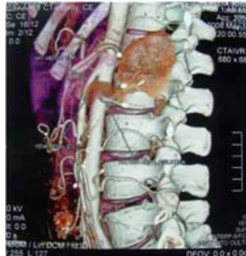
Imagen 3. La tomografía computarizada, en cortes sagital y coronal respectivamente, demuestra ectasia proximal de la VRI y ahusamiento al pasar entre la aorta y la AMS.

El síndrome de cascanueces es un trastorno infrecuente que se manifiesta por dolor y/o hematuria en pacientes de ambos sexos. Para el diagnóstico, el estándar de oro es la flebografía y también se usan, por ser menos invasivas, la ecografía Doppler, tomografía computarizada ("multislice" de preferencia) o resonancia magnética nuclear. La cirugía, abierta o endovascular, tiene el objetivo de resolver la obstrucción de la VRI y aliviar la hiperpresión de la misma.