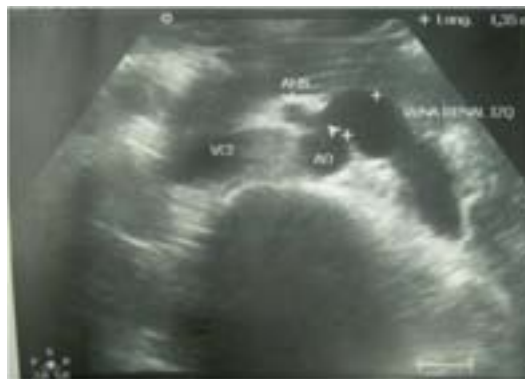
Imagen 1. El ultrasonido evidencia la VRI dilatada y la estenosis de la misma en el compás aortomesentérico.

La fisiopatogenia es muy similar al "síndrome del compás aortomesentérico", en el cual la tercera porción del duodeno es obstruida por estas mismas estructuras vasculares, lo que resulta en un cuadro de obstrucción digestiva alta. 7 No se comprobó en la literatura la coexistencia de ambas afecciones.