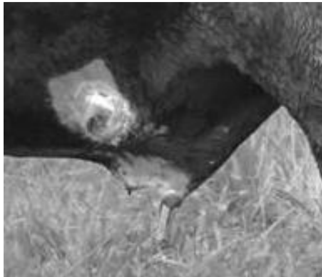
Figura 6. Cirugía terminada con colocación del dren y sutura con puntos en "U".