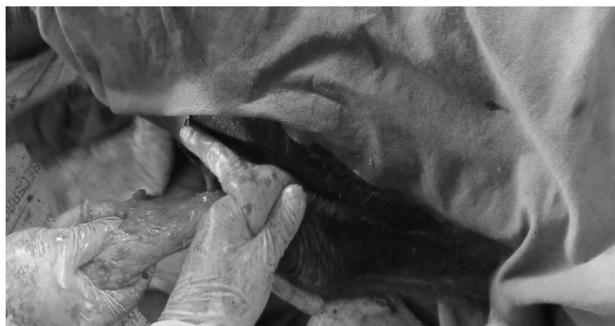
Figura 3. Desbridación y disección del forro en 2/3 de su longitud.

Posteriormente se procedió a desbridar el plano subcutáneo, utilizando tijeras de punta roma en dirección oblicua, esto es en el ángulo aproximado de desviación ( 45^{\circ} ); una vez desbridado, se deslizó el forro junto con la porción cutánea del prepucio, cuidando que no existieran torsiones (Figura 4).