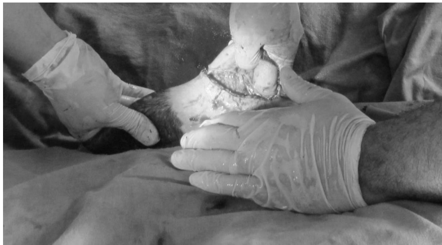
Figura 2. Disección de meato prepucial.