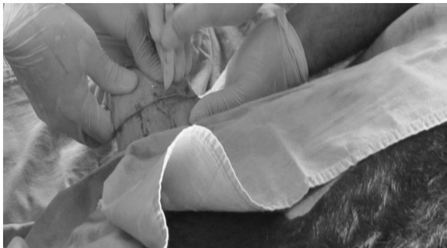
Figura 1. Incisión circular de meato prepucial.

El cirujano inició el corte a dos o tres cm del meato prepucial, utilizando primero hoja de bisturí del número 22 y posteriormente tijeras de punta roma para desbridar el forro; haciendo una disección de éste, con el fin de aumentar su movilidad. Una vez desbridado en 2/3 de su longitud, se realizó el corte circular utilizando hoja de bisturí del número 22, en la piel por delante de la babilla, calculando que sea ligeramente menor que el diámetro del prepucio (Figuras 1, 2 y 3).