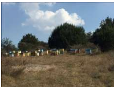
Figura I. Apiario en el Municipio de Jalostotitlán, Jalisco; donde se realizaron las observaciones de Ascosphaera apis

La apicultura en México, es una actividad de la que dependen aproximadamente 40 mil productores, quienes en conjunto poseen más de 2 millones de colmenas, lo que permite que México sea el quinto país productor y tercer exportador de miel a nivel mundial (SAGARPA, 2014). Jalisco ubicándose en el tercer lugar nacional. La producción apícola, a pesar de la presencia de la abeja Africana ( Apis mellifera scutellata ) e infestación con ácaros ( Varroa destructor ), ha registrado una importante recuperación (crecimiento anual 3%) que se ha sostenido durante los últimos 5 años, superando en los últimos 4 años, las 56,300 toneladas de miel; de las cuales se han exportado cerca de 29,109, principalmente a Europa (Alemania e Inglaterra) y Estados Unidos de Norteamérica (USA), generando ingresos por 32.4 millones de dólares anuales; lo que confirma que la apicultura es fuente de divisas (SAGARPA, 2014).