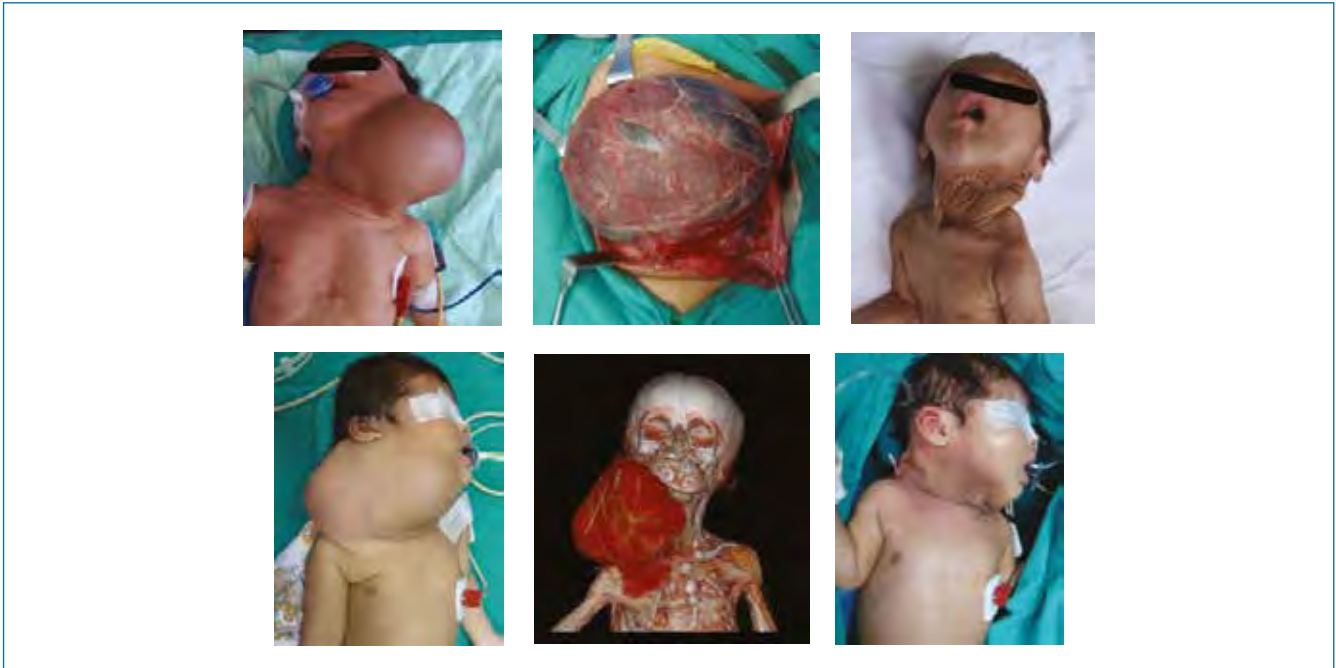
figura 1. Linfangioma supra e infrahioideo unilateral

los casos. Pero hay que tener presente que la cirugía puede presentar complicaciones, desde la cicatriz hasta el posible daño de estructuras nerviosas y vasculares, no siendo tampoco infrecuente la recidiva debido a la resección incompleta (8-12).