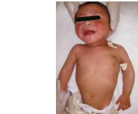
figura 5. Linfangiomas cérvico axilar

De los casos presentados, diez pacientes (3.9%) requirieron traqueostomía, de los cuales fueron 5 neonatos, y 5 de entre uno y once meses de edad. Los motivos de la traqueostomía corresponden a una parálisis del frénico, dos neumonías y siete insuficiencias respiratorias con uso de musculatura accesoria. En todos los casos la traqueostomía no se realizó durante el mismo procedimiento quirúrgico, sino durante los días postoperatorios y fue requerida de forma temporal, siendo retirada a los 2 meses posteriores.