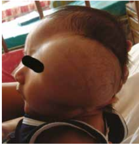
figura 3. Linfangioma temporal.

De acuerdo a la clasificación de De Serres, los linfangiomas supra e infrahioides unilaterales fueron los que más se presentaron en un 30.3% de los casos, seguida de la localización suprahioides unilateral y la infrahioides unilateral con 22.4 y 16.9% respectivamente. La ubicación del linfangioma a nivel de la glándula parótida y la región geniana son también de frecuente presentación con 10.6% y 7.9%. No podemos dejar de mencionar la localización torácica que desplaza el pulmón y el piso de la boca, los cuales por su proximidad se ven también comprometidos. (Tabla 4) (Figura 4 y 5).