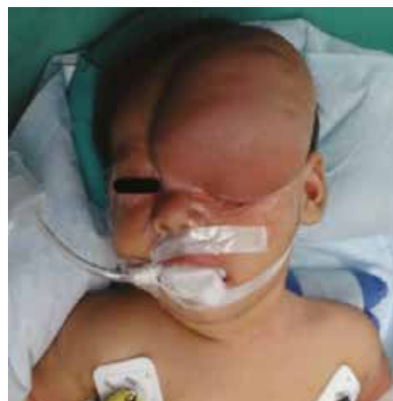
figura 2. Linfangioma frontal.