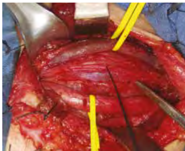
Figura 1. Después de la separación del músculo esternocleidomastoideo izquierdo, se observa la vena yugular interna y la arteria carótida común traccionados por vessel loop amarillos. El nervio vago izquierdo se señala con el estimulador de nervio Medtronic (Jacksonville, FL, USA), inferior a este y desplazando las 3 estructuras se aprecia la masa.

al especialista en cirugía de cabeza y cuello por un cuadro clínico consistente con una sensación de masa móvil no pulsátil en la parte inferior y lateral izquierda del cuello (nivel IV), que no estaba asociada a dolor, tos, cambios en la voz ni signos de infección local. Como ayudas diagnósticas se contaba con una tomografía contrastada de tórax y una resonancia de cuello más gadolinio que demostraba una masa ovalada de 9 x 4 cm desplazando hacia la derecha el lóbulo tiroideo izquierdo, la carótida común y la yugular interna de forma externa. La estroboscopia laríngea fue normal y la biopsia por aspiración no fue concluyente. Se realiza disección izquierda de cuello con monitorización nerviosa (Nim 3 Medtronic Jacksonville, FL, USA), en la que se observa una masa medial al músculo esternocleidomastoideo izquierdo que respetaba los grandes vasos. Durante el procedimiento quirúrgico se identifica y preserva el nervio vago, el cual no era el origen de la lesión como se consideró inicialmente. La disección de inferior a superior se continúa en un trayecto tipo “fino cordón nervioso” en dirección al bulbo carotideo hasta llegar al nervio hipogloso izquierdo, donde se evidencia que consiste, entonces, en una lesión originada en el asa del hipogloso. Al finalizar el procedimiento, se verifica la integridad y funcionalidad del nervio vago. La patología reportó neurofibroma luego del estudio por marcadores tumorales (Figura 1 y 2).