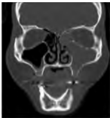
Figura 1. Tomografía simple de cara del paciente.

Se trata de un hombre de 45 años, agricultor, previamente sano. Consultó en otra institución por una obstrucción nasal izquierda, que se diagnosticó como sinusitis y se manejó ambulatoriamente con varios ciclos de antibióticos. Le realizaron una tomografía axial computarizada (TAC) simple de senos paranasales que mostró una ocupación de los senos maxilar y etmoidal izquierdo ( Figura 1 ).