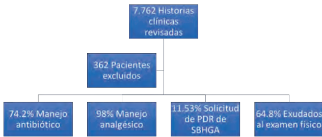
Gráfica 1. Resultados obtenidos en el estudio. Gráfica realizada por los autores