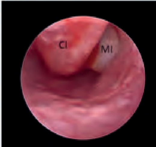
Figura 1. Nasolaringoscopia de la fosa nasal izquierda. Se observa material purulento a nivel del meato inferior (MI), cornete inferior (CI).