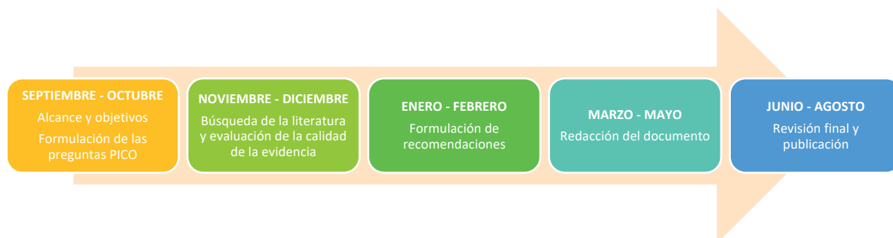
Figura 1. Metodología de elaboración de la guía. Elaboración propia.

La guía fue elaborada de septiembre de 2023 a agosto de 2024. (Figura 1)