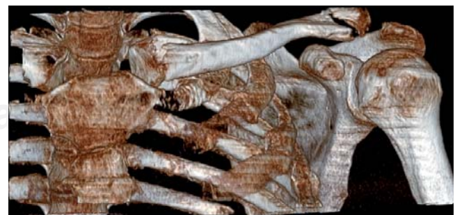
Figura 3. Tomografía computarizada con reconstrucción helicoidal que muestra: fractura luxación bipolar de clavícula izquierda (clavícula flotante).

Imágenes en color en: www.medigraphic.com/actamedica