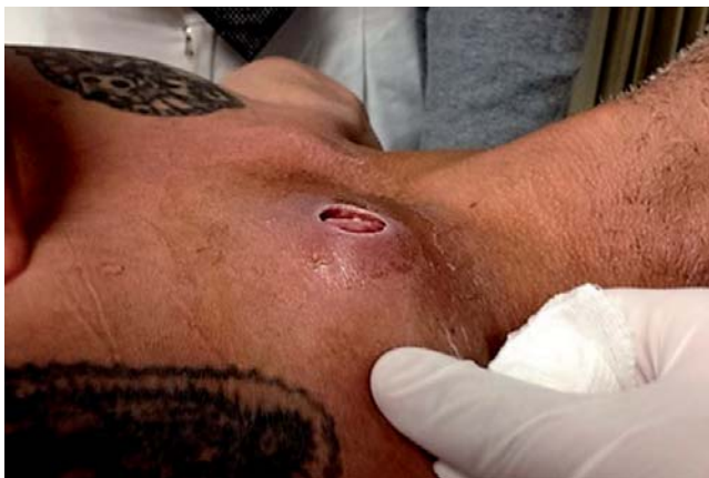
Figura 1. Pérdida de sustancia de 2 cm de diámetro sobre articulación esternoclavicular con fractura luxación en masculino de 50 años de edad.

una vez al día y clindamicina 600 mg dos veces al día. El electrocardiograma y la telerradiografía de tórax con silueta cardíaca y campos pulmonares revelaron fractura luxación bipolar de clavícula izquierda, la tomografía con reconstrucción helicoidal confirmó sus características. La lesión proximal de clavícula se catalogó en AO 15.B de tipo III B según la clasificación de Gustillo-Andersen y la lesión distal de clavícula en AO 15.3A1. Al cabo de 48 horas el cultivo reportó Staphylococcus epidermidis . Se decidió después de 10 días de antibioticoterapia y con resultados de segundo cultivo negativo efectuar ostectomía de 1.4 cm de la porción medial de clavícula, reconstrucción del ligamento costoclavicular y cierre de área con colgajo con inmovilización mediante cabestrillo reforzado con cinturón en velcro por cuatro semanas. En el seguimiento entre 10 y 20 días el paciente mostró buena evolución sin dato de infección, a las cuatro semanas se retiraron puntos y se canalizó a rehabilitación, a los 60 días del programa de rehabilitación el paciente fue dado de alta con calificación 15/100 en la escala de DASH ( Disability of the Arm Shoul-