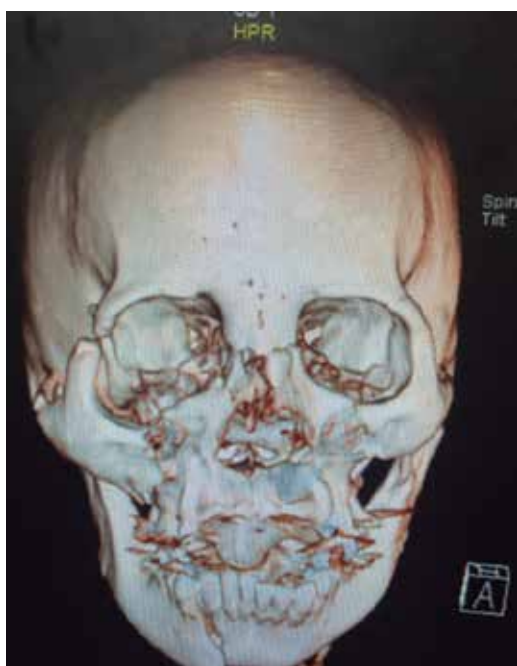
Figura 1. Tomografía computarizada con reconstrucción tridimensional donde se observa una fractura de malar en trípode con fractura de piso de órbita.

El objetivo es una mejoría funcional (tratamiento de signos y/o síntomas como diplopía, hiperestesias del nervio infraorbitario, limitación de los movimientos mandibulares, etcétera) y una mejora estética (tratamiento de la asimetría facial, distopía ocular, mal posiciones del párpado inferior, entre otros). 20,21 La cirugía se realiza bajo anestesia general y, dependiendo del grado de desplazamiento de los fragmentos de la fractura, la reducción puede hacerse de manera abierta (por medio de abordajes que expongan directamente el foco de fractura) o cerrada (se accede y manipula el hueso fracturado a través de una incisión lejana). 22 El periodo de ingreso hospitalario suele oscilar entre 24 y 48 horas, aunque puede verse ampliado dependiendo del grado de inflamación y si el desplazamiento de las fracturas obliga a realizar grandes abordajes para su reducción ( Figuras 3