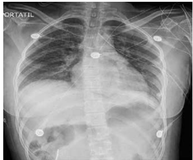
Figura 3: Se realiza radiografía de tórax posteventración diafragmática y postcolocación de sonda endopleural, con evolución satisfactoria y resolución de neumotórax izquierdo.

Se continúa con la hepatorrafia y esplenorrafia con control hemostático, se coloca drenaje de tipo Penrose hacia corredera parietocólica izquierda y hacia lecho esplénico, se prosigue con cierre por planos hasta llegar a piel sin accidentes ni incidentes, continuando en un segundo tiempo, se practica incisión transversa en quinto espacio intercostal línea axilar anterior, se diseca hasta cuerpos costales, se hace perforación pleural, colocándose sonda pleural #28, fijándose con sutura con seda del número 3-0, y se conecta a cámara de sello de agua, verificando su función, dado por terminado el acto quirúrgico con diagnóstico postoperatorio de trauma toracoabdominal cerrado, más ruptura diafragmática izquierda, más neumotórax izquierdo, más trauma hepático en su segundo grado y trauma esplénico en su primer grado.