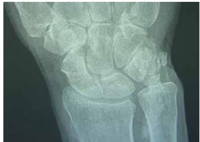
Figura 4: Radiografía posteroanterior del carpo derecho que revela depósitos cálcicos a nivel de los tendones cubitales anteriores y posteriores.