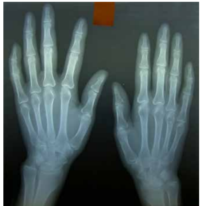
Imagen en color en: www.medigraphic.com/actamedica

Mujer de 54 años, sin antecedentes de importancia, con inicio de sintomatología de 12 años de evolución con dolor y edema de ambas manos ( Figura 1 ) predominando la izquierda, con aparición insidiosa de nódulos duros subcutáneos que fueron creciendo paulatinamente causando deformación de ambas manos ( Figura 2 ), refiere mayor dolor cuando utiliza agua fría, sin llegar a notar cambios en coloración. De dos años a la fecha se le prescribieron inhibidores de bomba de protones por reflujo gastroesofágico, fue manejada por varios años como gota tofácea a pesar de niveles normales de ácido úrico ( Figura 3 ). En biopsia endoscópica se detectó esofagitis inespecífica. Los exámenes de laboratorio muestran: citometría hemática, glucosa, urea, creatinina, ácido úrico, colesterol, calcio, magnesio, fósforo, sodio y potasio, todos dentro de límites normales; velocidad de sedimentación globular en 40 mm/h, fosfatasa alcalina 150 UI/L; anticuerpos antinucleares positivo 1:320, anti-ADN negativos, anticuerpos anti-centrómero positivos, anticuerpos anti-topoisomerasa (anti-Scl-70) negativos. Con diagnóstico esclerosis sistémica en su variedad de síndrome de CREST 1 por presentar al menos tres criterios, predominando la calcinosis, 2,3 la cual pudiera considerarse de tipo tumoral por el tamaño de las lesiones. 4 Se inicia manejo con etidronato y se refiere a los servicios de reumatología y cirugía de mano para control y manejo.