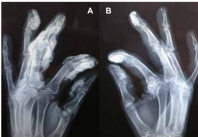
Figura 3: Radiografías oblicuas de ambas manos; (A) en mano izquierda se observan grandes depósitos calcáreos en pulpejos y calcificaciones polimorfas en vainas tendinosas de flexores y extensores de los cuatro primeros dedos, con mayor afección del tercero; (B) en mano derecha depósitos calcáreos en pulpejos de los cuatro primeros dedos y articulación metacarpo-falángica del dedo índice; nótese la nula afección intraarticular.

Imagen en color en: www.medigraphic.com/actamedica