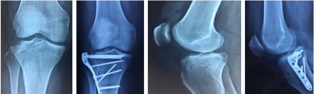
Figura 1: Fractura de meseta tibial con hundimiento lateral/osteosíntesis con adecuada reducción y colocación de placa anatómica.

La reducción asistida por artroscopia se ha vuelto popular en los últimos años, la gran ventaja es reducir bajo visión directa sin necesidad de dañar las inserciones meniscales. 5