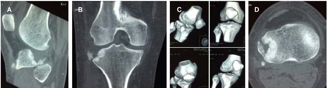
Figura 2: Tomografía de rodilla que evidencia el hundimiento articular. (A) Corte sagital. (B) Corte coronal. (C) Reconstrucción en 3D. (D) Corte axial.