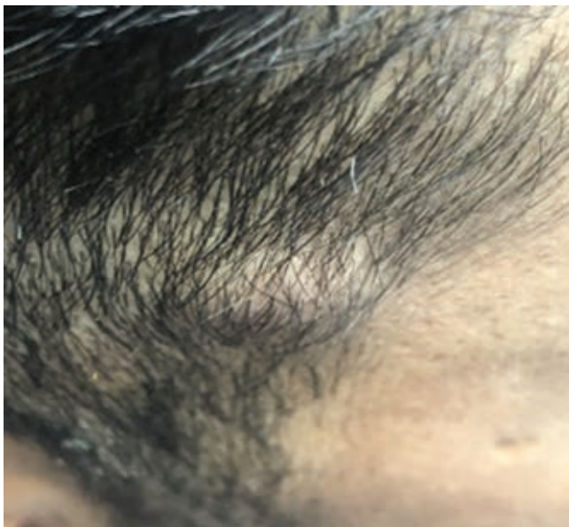
Figura 1: Masa pulsátil a nivel de trayecto ATS derecha, la cual en una exploración vascular no muestra presencia de frémito o soplos en dicho trayecto, con diámetro aproximado de 1-2 cm, no dolorosa y desplazable.

ocupación: constructor, sin antecedentes de importancia. Inicia su padecimiento tres meses antes de su interrogatorio, en el mes de julio de 2019, posterior a una agresión por terceras personas sufre golpe a nivel de región frontoparietal derecha con posterior aparición de masa pulsátil indolora, la cual fue progresando de manera paulatina. Dicha masa se encuentra en el trayecto de la ATS, la cual como sintomatología específica únicamente presenta aumento de volumen y dolor ocasional 3/10 en la escala visual análoga