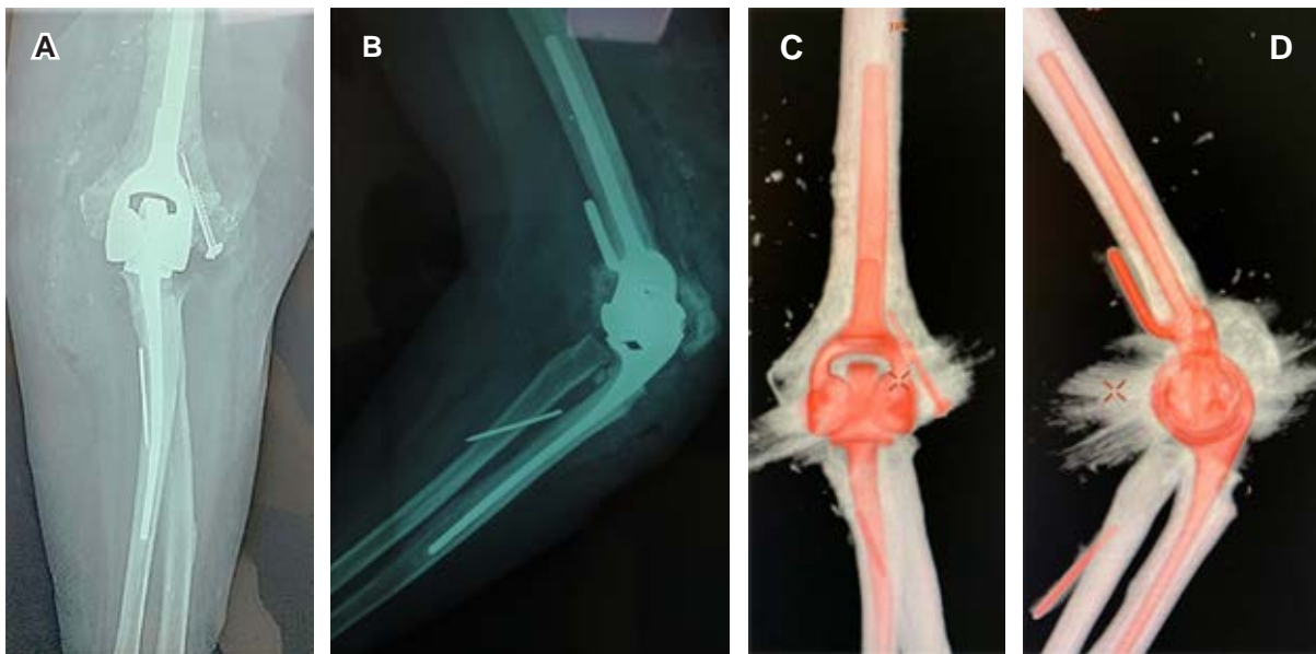
Figura 3: A y B) Imágenes radiográficas y C y D) tomográficas en vistas anteroposterior y lateral, muestran prótesis total de codo izquierdo en femenino de 77 años.

relativas son: pacientes quienes carecen de tríceps, pacientes quienes no están dispuestos o no pueden adherirse a limitaciones de actividad, trabajadores que manipulan objetos pesados y personas dependientes de dispositivos de asistencia de extremidades superiores para la ambulación.