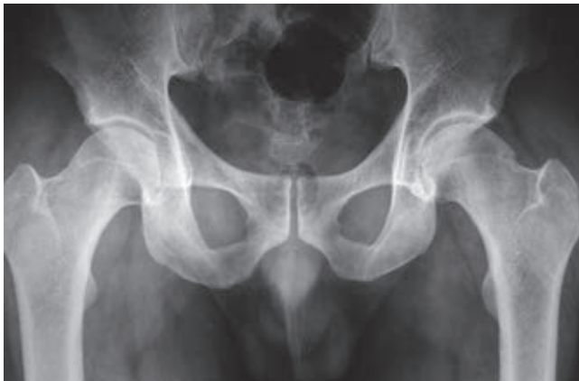
Figura 1: Radiografía anteroposterior de pelvis que muestra alteración de la unión de la cabeza con el cuello femoral izquierdo.

El pinzamiento femoroacetabular tipo leva (FAI tipo CAM por sus siglas en inglés) (la leva es un elemento mecá-