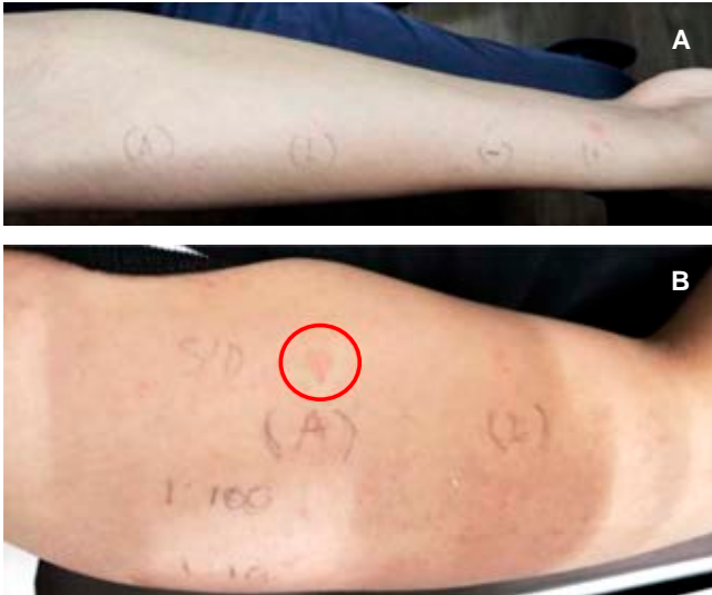
Figura 3: Resultado de las pruebas realizadas al paciente: A) prick; B) intradérmicas, el círculo rojo muestra la positividad a la prueba con articaína sin dilución. A = articaína; L = lidocaína; S/D = sin dilución.

necesario realizar pruebas de parche para identificar el mecanismo implicado. 5