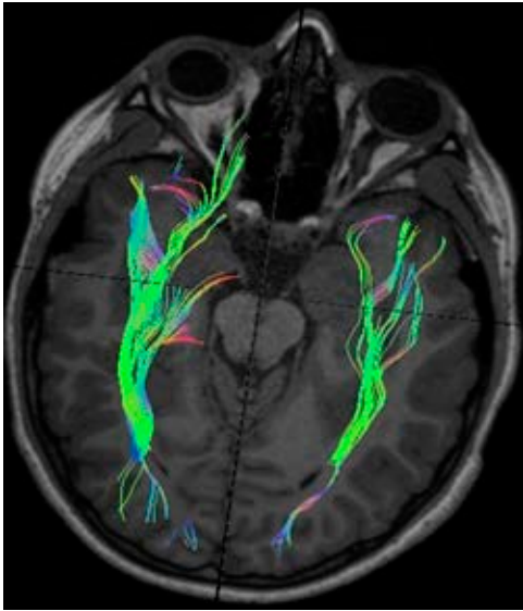
Figura 3: Paciente 3, disminución en el número de fibras ópticas del lado izquierdo.

nervios comúnmente caracterizada por edema o inflamación de la primera porción del nervio óptico; sin embargo, la tractografía, además de evidenciar la interrupción de los trayectos por el mismo proceso inflamatorio, nos permite observar el número y volumen de las fibras afectadas, lo que finalmente será interesante analizar en una mayor muestra de pacientes que realice un seguimiento más es-