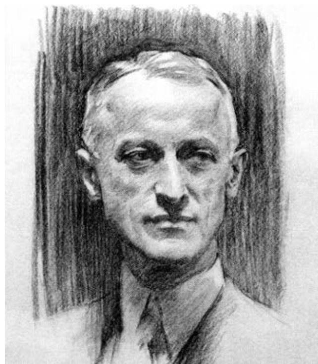
Figura 1: Harvey Cushing, pintura realizada por John Singer a lápiz en 1916 (que se encuentra en “Yale Museum of Art” y se reproduce en el libro “A Life in Surgery” de M. Bliss, Oxford University Press).

diario que los ilustraba con dibujos, bosquejos, retratos a lápiz y diseños quirúrgicos. De manera minuciosa recababa y archivaba la correspondencia personal y profesional así como la del acervo familiar; de tal manera que uno po-