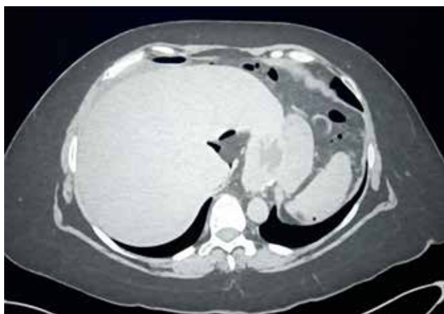
Figura 1: Aire libre en cavidad abdominal.

Femenino de 54 años con antecedente de alergia a la penicilina, hipertensión arterial sistémica en tratamiento y múltiples cirugías abdominales (apendicectomía, colecistectomía, tres cesáreas, colocación de banda gástrica en 1999 y retiro en 2016 con conversión a bypass gástrico en Y de Roux). Acude por presentar dolor abdominal de 24 horas de evolución, a su ingreso a urgencias se encuentra diaforética, con palidez de mucosas y deshidratación moderada, abdomen distendido, dolor a la palpación de forma generalizada, rebote positivo, resistencia muscular involuntaria, peristalsis hipoactiva. Los estudios de laboratorio muestran hemoglobina de 16.81 g/dL y conteo normal de leucocitos de 8.05 \times 10^9 cel/L, se decide iniciar reanimación hídrica intravenosa con éxito y posteriormente