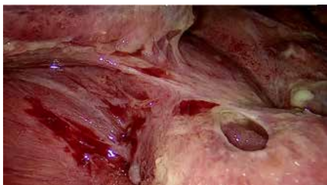
Figura 2: Perforación yeyunal en laparoscopia.