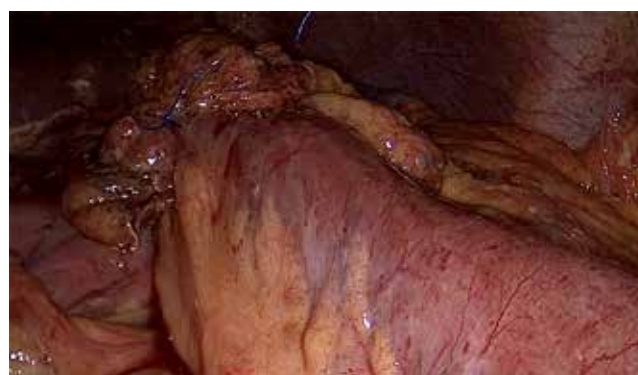
Figura 4: Parche de epiplón.

se realiza tomografía abdominal computarizada (TAC) en la que se observa aire y líquido libre en hueco pélvico sin observar sitio de perforación ( Figura 1 ). En la laparoscopia diagnóstica se observan múltiples adherencias, líquido purulento aproximadamente 200 cm 3 y perforación a 5 cm de la CYA de aproximadamente 0.5 cm ( Figura 2 ). Se realiza cierre primario y parche de epiplón, así como lavado y drenaje de la cavidad ( Figuras 3 y 4 ), se egresa al día cinco postoperatorio sin eventualidades.