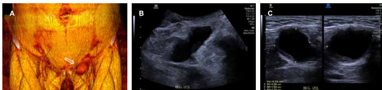
Figura 1: (A) Reconstrucción 3D de tomografía computarizada, que muestra un aumento de volumen en la región inguinal izquierda (flecha hueca). Imágenes de ultrasonido en escala de grises con transductores convexo (B) y lineal (C) de la misma región, donde se observa una imagen hipoeoica de 27 × 20 × 19 mm y un volumen de 5.8 cm 3 , en el trayecto del ligamento redondo ipsilateral.

La endometriosis del ligamento redondo presenta un desafío diagnóstico significativo debido a su similitud clínica