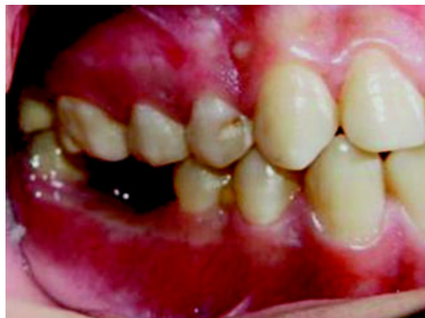
Figura 7. Vista lateral de la región donde estaba la lesión después del tratamiento.

El linfoma de Burkitt es el tumor con mayor velocidad de crecimiento 11 ; las manifestaciones hematológicas como equimosis, petequias y ocasionalmente epistaxis 28 , aparecen en 30 a 50% de los casos. En este caso, había petequias en el paladar