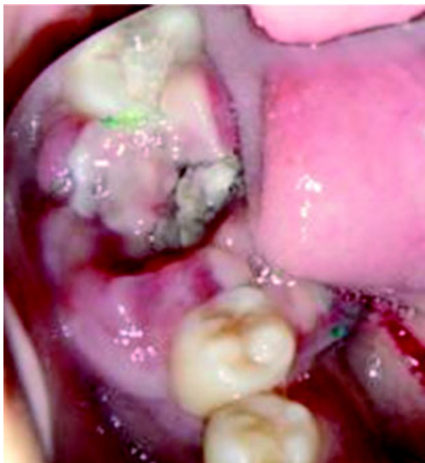
Figura 5. Alvéolo desocupado del primer molar derecho; obsérvese el proceso anormal de cicatrización y las zonas de necrosis de un mes de evolución.

zona correspondiente del canino al primer molar superior derechos, aunque clínicamente no había alteración (Figura 6).