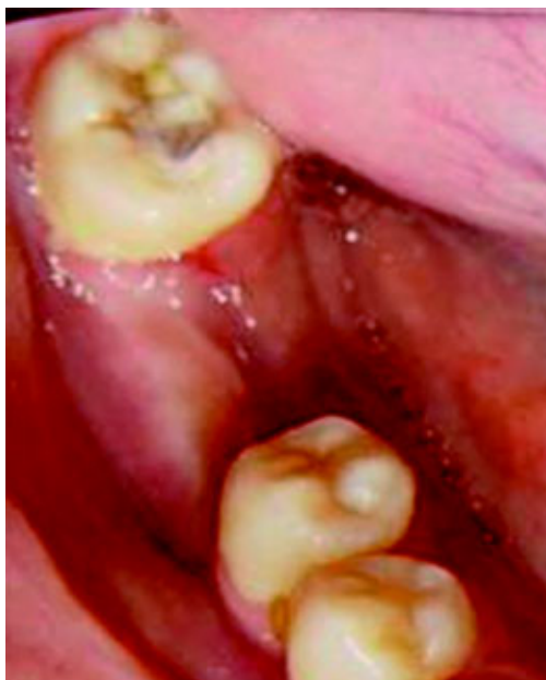
Figura 8. Coloración y cicatrización adecuadas de la región donde estaba la lesión.