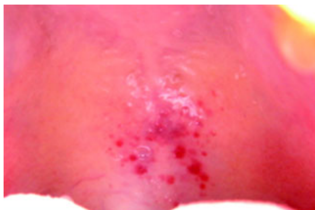
Figura 3. Petequias en el paladar blando.