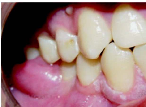
Figura 4. Tumor de encía del primer molar derecho.