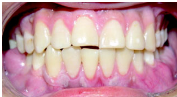
Figura 2. Palidez y resequead de las mucosas.

Se solicitó ortopantomografía que mostró zonas radiolúcidas (lisis ósea) del primer premolar al segundo molar inferior derechos y en el maxilar, la