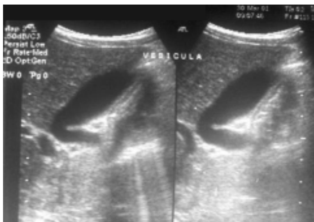
Figura 9. Ultrasonido de vías biliares que muestra dilatación no calculosa de la vesícula biliar.

Manifestaciones gastrointestinales. El dolor abdominal , la diarrea y las náuseas son comunes; se observan en 20% de los pacientes en los primeros días de la enfermedad; ocasionalmente, son acentuados y