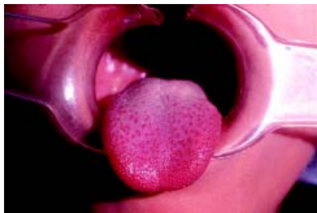
Figura 3. Lengua enrojecida y con prominencia de las papilas lo que da apariencia de fresa.