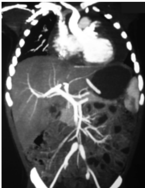
Figura 12. Angiotomografía que muestra aneurisma de arterias iliacas.

Los aneurismas de las arterias sistémicas (Figura 12) ocurren en 2% de los pacientes, generalmente en quienes tienen aneurismas de las arterias coronarias. Las arterias que más se afectan son las renales, paraováricas, paratesticulares, mesentéricas, pancreáticas, iliacas, hepáticas, esplénicas y axilares.