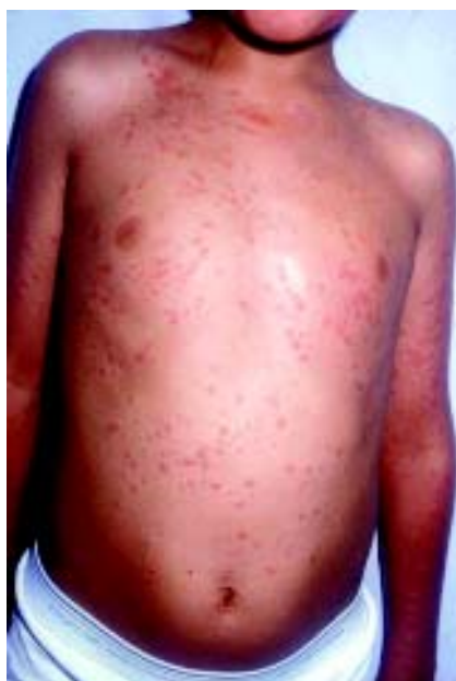
Figura 4. Paciente con enfermedad de Kawasaki; el exantema maculopapular se inició en extremidades y se extendió al tronco.

Exantema polimorfo. El exantema puede adoptar muchas formas, no es vesicular. El más común es maculopapular, intensamente eritematoso que se inicia en el tronco y en las extremidades; muestra ligera elevación en sus márgenes, con pápulas de 2 a 3 mm de extensión o placas coalescentes de varios centímetros (Figura 4). La distribución del exantema es difusa; se observa frecuentemente en la cara formando una pseudomascara (Figura 5), aunque puede ser prominente en tronco o en las extremidades; en niños pequeños puede ser muy acentuado en el periné y en las ingles (Figura 6). En este último sitio es bastante común tanto en niños que usan pañal como en los que ya no lo requieren. Esto sucede antes de que ocurra la descamación periungueal que aparece en la fase subaguda y puede estar presente en la fase febril aguda.