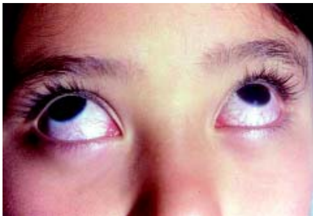
Figura 1. Hiperemia conjuntival, sin secreción en una paciente con enfermedad de Kawasaki, la afección predomina en la conjuntiva bulbar.

Inyección conjuntival. Se afecta más la conjuntiva bulbar que la palpebral o tarsal en forma bilateral; no hay exudado; no hay ulceraciones o edema de la conjuntiva y la cornea, lo que distingue la enfermedad del síndrome de Stevens-Johnson. (Figura 1) La hiperemia conjuntival aparece en la primera semana de la enfermedad, habitualmente se inicia entre el segundo y