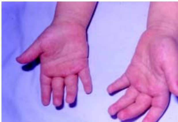
Figura 7. Nótese el eritema en las palmas que a menudo es llamativo, sufriendo un cambio abrupto de lo normal al eritema superficial.

Adenopatía cervical no purulenta. Es el menos constante de los datos; ocurre en 50 a 75% de los casos. Para