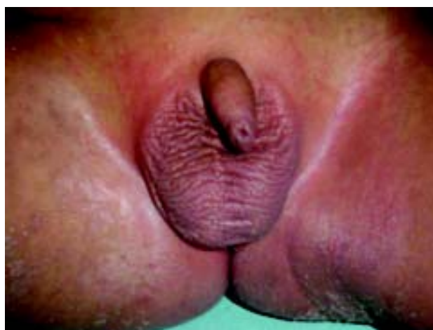
Figura 6. Aunque el exantema puede ser prominente en tronco o extremidades, en niños pequeños se puede observar, como en este caso, un eritema muy acentuado en el periné y en las ingles.

eritrodermia escarlatiniforme. Se observan ocasionalmente finas pústulas sobre las superficies extensoras de las articulaciones. Este exantema aparece generalmente dentro de los primeros cinco días del inicio de la fiebre.