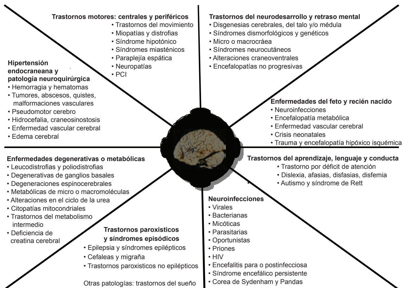
Figura 2. Padecimientos distribuidos por grupos que suelen tratarse en un tercer nivel o que requieren la ayuda de un neurólogo pediatra.