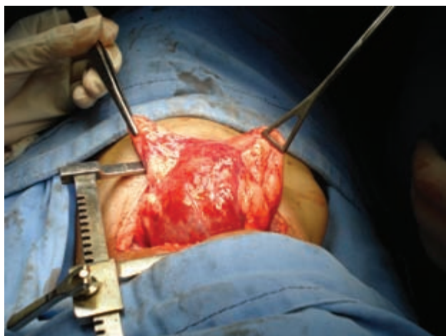
Figura 3. Fotografía tomada durante el evento quirúrgico. Al realizar una toracotomía posterolateral izquierda se exteriorizó el pulmón y se observó una gran lesión quística adherida al parénquima pulmonar del lóbulo inferior izquierdo.