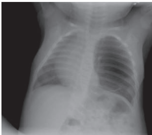
Figura 1. Radiografía de tórax que muestra del lado izquierdo una lesión quística, bilobulada, hiperlúcida, que desplaza las estructuras del mediastino al hemitórax derecho.

Niña de tres meses de edad, enviada por el Servicio de Neumología Pediátrica con diagnóstico de malformación pulmonar congénita sospechada por una radiografía de tórax. Producto de una madre de 29 años de edad, primigesta, embarazo normoevolutivo sin complicaciones. Un ultrasonido obstétrico a las 22 semanas de gestación mostró imágenes de un quiste pulmonar del lóbulo superior izquierdo, sin aporte sanguíneo anómalo (aorta) que lo nutra. Por el antecedente de la malformación pulmonar la niña nació por cesárea, a término. Pesó 3,100 g; no tuvo asfixia perinatal ni sintomatología respiratoria. La radiografía de tórax al nacimiento mostró una imagen hiperlúcida pequeña en el lóbulo superior izquierdo. Debido a la ausencia de síntomas fue egresada del hospital. A los tres meses de edad, acude a control pediátrico; la radiografía de tórax mostró una imagen en el hemitórax superior izquierdo, redondeada, hiperlúcida, con escaso parénquima pulmonar, que desplaza las estructuras del mediastino hacia la derecha (Figura 1). Una tomografía de tórax permitió identificar tres imágenes ovoides en el lóbulo superior izquierdo, la mayor de aproximadamente 7.7 x 4.1 cm con -994 UH (Figura 2), lo que hizo sospechar una malformación congénita de la vía aérea pulmonar. Se decidió realizar una toracotomía posterolateral izquierda.