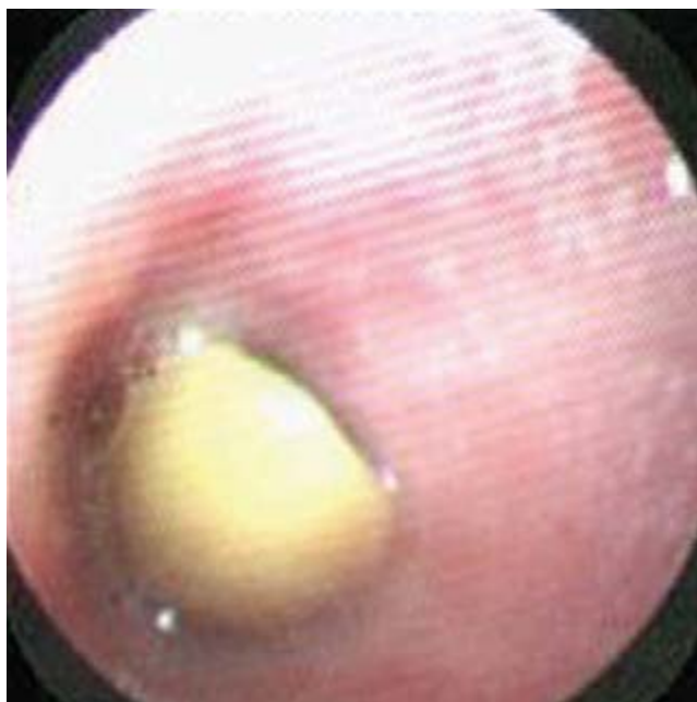
Figura 2. Se observa una semilla de cacahuate alojada en bronquio derecho.

extraño fue en tráquea en nueve (14.4%); en la carina en cuatro (4.8%); en el bronquio derecho en 52 (62.4%) y en el bronquio izquierdo en 19 (22.8%). El tipo de cuerpo extraño alojado en la vía aérea fue de origen orgánico en 57 niños (68.4%) de los cuales 28 (33.6%) eran cacahuates, semillas de maíz en 11 (13.2%) (Figuras 2 y 3), semillas de frijol en siete (8.4%); semillas de sandía en tres (3.6%), restos de arroz en dos (2.4%), cáscara de pistache en dos (2.4%) hueso de pollo en dos (2.4%), semilla de pimienta en uno (1.2%) y restos de carne en uno (1.2%). Los objetos inorgánicos hallados en 27 niños (32.4%) fueron: 14 (16.8%) metálicos: tachuela, aguja, alfiler, clavo, arete, clip, silbato (Figuras 4, 5); tapones de plástico en ocho (9.6%); tres (3.6%) con restos de plástico de un globo, uno (1.2%); botón de ropa en uno (1.2%). Las complicaciones que ocurrieron fueron: endobronquitis en 36 (43.2%); insuficiencia respiratoria que requirió ventilación mecánica en siete (8.4%); neumonía en cinco (6%); sangrado leve en tres (3.6%) y absceso pulmonar apical derecho en uno (1.2%). La evolución de los 84 pacientes fue favorable; sólo el paciente con absceso pulmonar tuvo que ser tratado con antimicrobianos por vía intravenosa durante tres semanas, inicialmente con un esquema de penicilina G sódica cristalina y posteriormente con cefotaxima a 150 mg por kilogramo por día y dicloxacilina a 200 mg por kilogramo. El paciente egresó en buen estado.