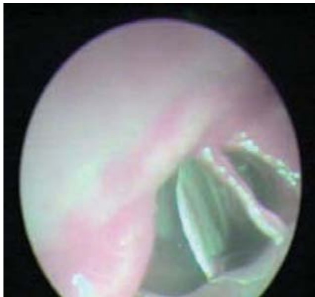
Figura 4. Se visualiza un silbato metálico en bronquio derecho.