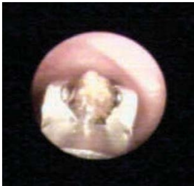
Figura 3. Momento de la extracción de un grano maíz de bronquio derecho.