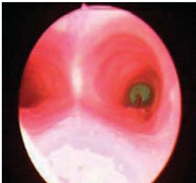
Figura 5. Observamos un alfiler con cabeza en bronquio derecho.

a nivel del cartílago cricoides, sobre todo en el lactante, cuya función epiglótica no está bien desarrollada. Cuando un cuerpo extraño se aloja en la glotis, de inmediato produce tos, atragantamiento y disfonía además de estridor y dificultad respiratoria. Si el cuerpo extraño se aloja en la abertura glótica, el niño presenta cianosis y lucha por respirar con mayor esfuerzo, momento en el cual está indicado realizar la maniobra de Heimlich 2 . Cuando el cuerpo extraño pasa a través de la glotis, se aloja en un bronquio o alguna de sus ramas y el cuadro clínico que ocasiona no es de insuficiencia respiratoria aguda ya que permite una ventilación parcial, la expresión clínica es tos y sibilancias, que puede tener varios días de evolución.