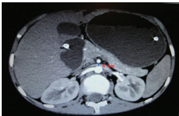
Figura 3. Tomografía que revela distancia de 5 mm entre la arteria mesentérica y la aorta abdominal; obsérvese la compresión duodenal.