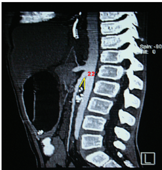
Figura 2. Angiotomografía que muestra un ángulo aortomesentérico de 22° con la compresión duodenal.