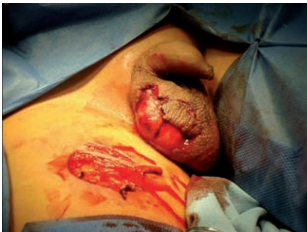
Figura 1. Efecto de la exposición a la energía liberada durante la detonación de un artefacto explosivo. Se observa el gran daño testicular.

Se prescribieron analgésicos (metamizol) durante tres días. En el postoperatorio se reinterrogó al niño respecto al accidente y ratificó que la explosión dañó su pantalón