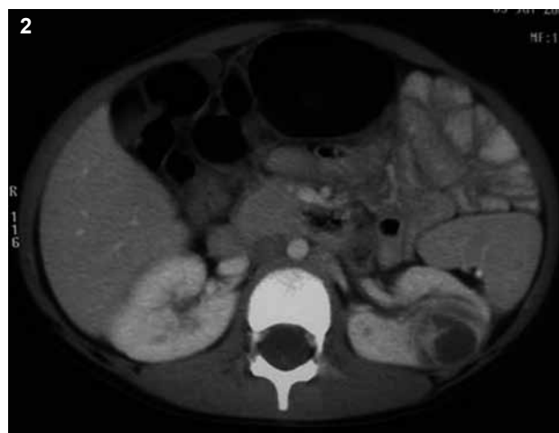
Figura 1 y 2. TAC. Múltiples imágenes hipodensas en el parénquima renal izquierdo, con paredes regulares, que deforman el contorno de los polos. El riñón contralateral es normal.

Se decidió realizar laparotomía para una exploración renal bilateral y tomar una biopsia transoperatoria que permitiera normar la conducta quirúrgica. Se colocó un catéter central en la vena subclavia derecha, (Figura 3) para medir la presión venosa central durante la operación, para continuar la infusión de soluciones, toma de muestras sanguíneas y continuar antibióticos en el postoperatorio. El riñón derecho era normal. Para abordar el riñón izquierdo, se incidió la fascia de Gerota y se disecó el paquete vascular, para controlar las estructuras vasculares. (Figura 4) En la superficie de la cara posterior del riñón se veía la grasa perirrenal sellando áreas de un proceso inflamatorio en los polos superior e inferior. Existía abundante mate-