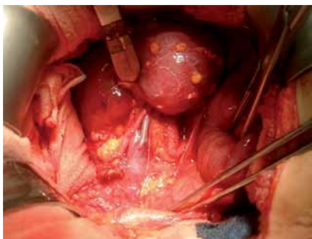
Figura 4. Incisión de la fascia de Gerota con disección del paquete vascular para controlar las estructuras vasculares.

rial purulento, (Figura 5) que fue aspirado con jeringa y enviado a cultivo. Se drenaron ambos abscesos y se envió una biopsia transoperatoria del sitio adyacente a la lesión, cuyo estudio reveló un proceso inflamatorio sin evidencia de neoplasia. Se hizo un aseo cuidadoso y se dejó un drenaje. Se administró triple esquema de antibióticos. La paciente evolucionó favorablemente. Se inició la vía oral a las 24 horas con buena tolerancia, la fiebre desapareció durante el primer día. Drenaron 20 mL al día de material seropurulento; se retiró el drenaje a las 48 horas.