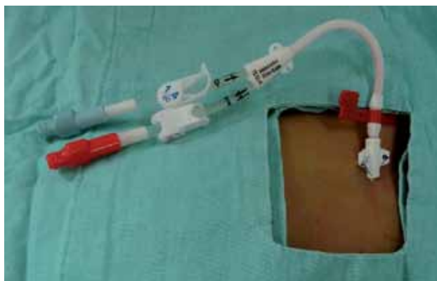
Figura 3. Colocación de catéter central en la vena subclavia.