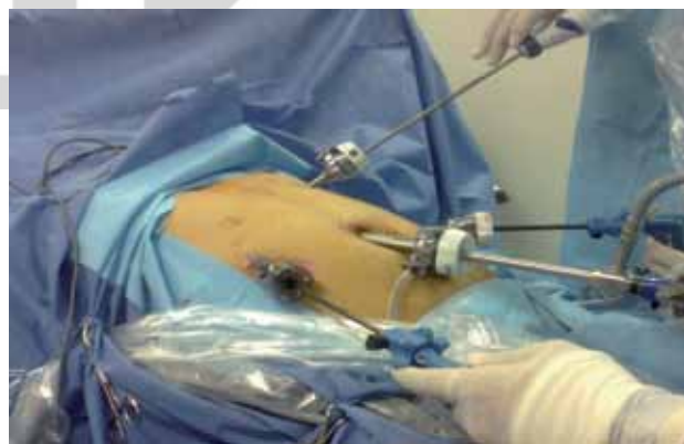
Figura 1. Colocación de los puertos.

Durante enero del 2010 a noviembre del 2012 se diagnosticaron ocho pacientes con quiste de colédoco; cuyas edades iban de los tres a los 17 años con promedio de ocho años; fueron dos hombres y seis mujeres. El dolor abdominal fue el síntoma principal en los ocho pacien-