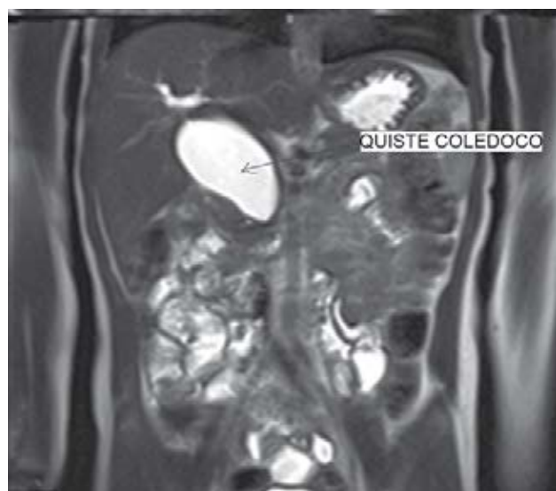
Figura 2. Colangiografía resonancia contrastada: que muestra la dilatación quística del colédoco.

tes (Cuadro 1). Se diagnosticaron cinco con ultrasonido (US), tomografía (TC), resonancia magnética (RMN), tres con US y TC (Figura 2). El tipo de quiste de acuerdo a la clasificación de Todani fue seis con quiste de colédoco Tipo I (dilatación quística del colédoco) y dos con tipo IVa. El tiempo quirúrgico varió de 150 a 330 minutos con promedio de 250 minutos (Cuadro 2). Se mantuvo la sonda nasogástrica entre 24 y 72 horas. Se inició la vía oral entre tres y nueve días con promedio de cinco días y medio. El tiempo de estancia hospitalaria varió entre cinco y 14 días con promedio de siete días y medio. Un paciente tuvo una complicación postoperatoria: una fuga de anastomosis al tercer día postoperatorio. Se trató de manera conservadora con ayuno, nutrición parenteral total y octreótide por siete días. Otro paciente tuvo reflujo duodeno-gástrico tratado con sucralfato (Cuadro 3). Durante el seguimiento de dos años no ha habido un solo caso de colangitis.