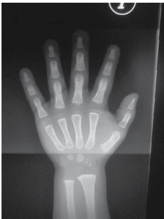
Figura 6. Radiografía de la mano izquierda: dos núcleos de crecimiento en el carpo y núcleos de crecimiento en falanges y radio. Edad: tres años, lo que indica que la maduración ósea está atrasada para la edad cronológica de la paciente.

Para determinar la edad ósea, como seguimiento y control del hipotiroidismo se le tomó una radiografía de la mano, a los tres años 11 meses de edad, que mostró dos núcleos de crecimiento en el carpo y núcleos de crecimiento de las falanges y del radio; ello indicó una maduración ósea que corresponde, aproximadamente, a la de un año para el centil cincuenta; además, las falanges son anchas y los tejidos blandos se encuentran aumentados de volumen, lo que indicó que su maduración ósea estaba atrasada para su edad cronológica (figura 6). Actualmente la paciente se encuentra en seguimiento por diversos especialistas del Instituto Nacional de Pediatría.