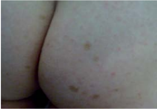
Figura 3. Manchas de color café con leche.

genitales femeninos normales; periné corto; región perianal normal, extremidades íntegras con hipotonía y clinodactilia del quinto dedo.