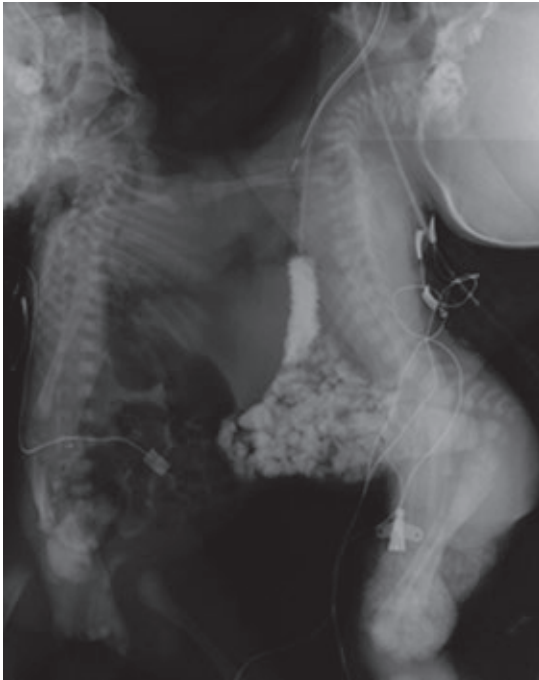
Figura 5. Serie esofagogastroduodenal. Se administró una pequeña cantidad de medio de contraste hidrosoluble a través de la sonda nasogástrica del gemelo 2; no compartían ningún segmento del tubo digestivo como ocurre en 50% de los casos.

no habría suficiente piel para cubrir las partes expuestas de cada gemelo, por lo cual se decidió que se colocarían expansores tisulares en la cara anterior de ambas parrillas costales. Se realizó el procedimiento quirúrgico posterior al cual presentó inestabilidad hemodinámica, que requirió el uso de aminas; 51 días después del ingreso se llevó a cabo la separación de órganos. La intervención duró diez horas, se colocó una malla de titanio en la pared torácica debido a la ausencia de la mitad de la parrilla costal que compartían los gemelos y no había suficiente piel para una cobertura adecuada.