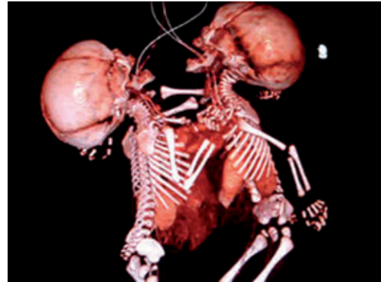
Figura 6. Reconstrucción tridimensional volumétrica que muestra ambos corazones emergiendo centralmente a través de la apertura amplia de las cajas torácicas. Los estómagos separados con sus correspondientes sondas nasogástricas se ubican a la izquierda de cada gemelo ( situs solitus ).

En el posoperatorio se tuvieron que emplear aminas. Debido a la tetralogía de Fallot y al hecho de haber tenido el tórax abierto, hubo