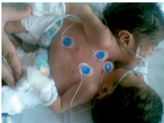
Figura 1. Unión toracoabdominal sin otras alteraciones aparentes.