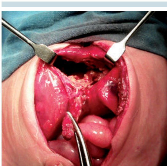
Figura 1. Transoperatorio: gran cavidad hepática con tejido glandular destruido sobre tejido inflamado.