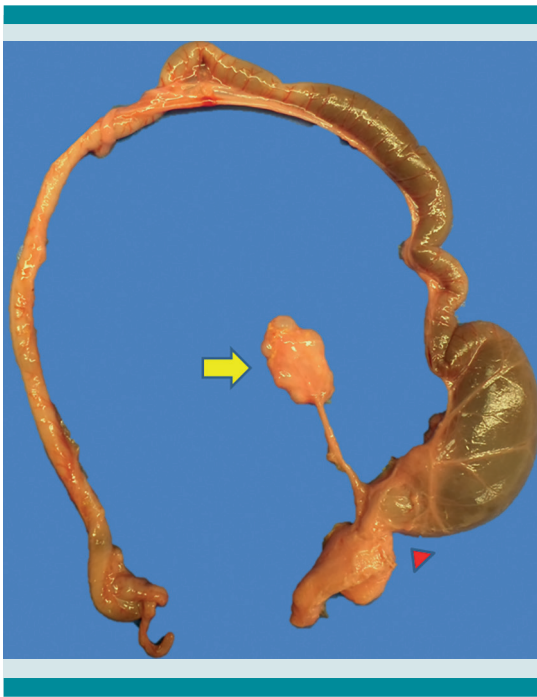
Figura 1. Foto macroscópica que muestra segmento de colon descendente dilatado, con fístula hacia vejiga (punta de flecha roja). También se observa riñón de lado izquierdo disminuido de tamaño (1.1 vs. 17 g) y de aspecto multiquistico.