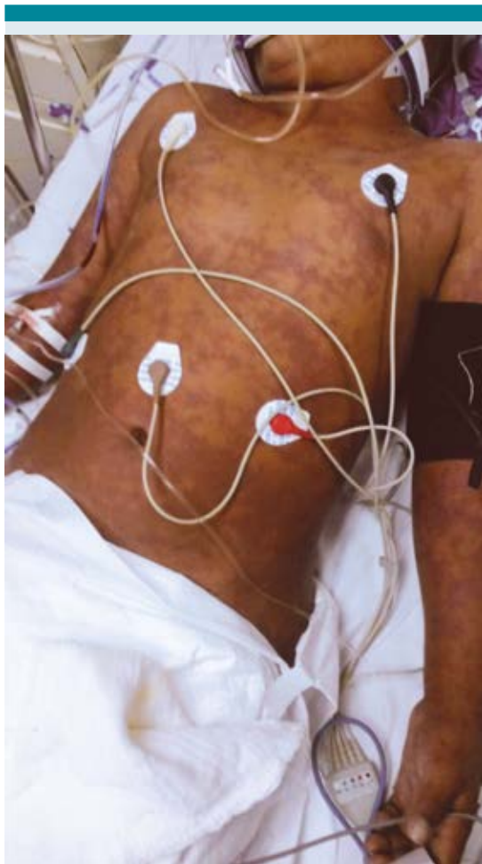
Figura 1. Caso 1. Paciente con exantema purpúrico y edema generalizado (séptimo día del ingreso hospitalario).

que afectaban las plantas y palmas. Los estudios de laboratorio reportaron leucocitosis ( 13.3 \times 10^3/\mu\text{L} ) con neutrofilia ( 11.5 \times 10^3/\mu\text{L} ) y linfopenia ( 1.02 \times 10^3/\mu\text{L} ), plaquetopenia severa ( 10 \times 10^3/\mu\text{L} ); concentraciones elevadas de urea (123 mg/dL) y creatinina (1.2 mg/dL); hipoproteinemia (1.9 g/dL), hipoglobulinemia (1.5 g/dL), hiponatremia (120 meq/L); elevación de glutamato-oxaloacetato transaminasa (TGO: 369.9 U/L) y glutamato-piruvato transaminasa (TGP: 59.1 U/L); bilirrubina total de 7.3 mg/dL,