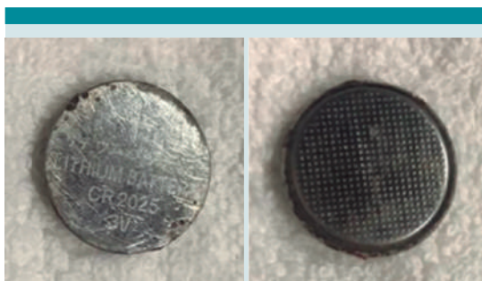
Figura 3. Batería de botón de Litio Cr 2025 3V a la altura del tercio medio esofágico de 2 x 1.6 mm. A) Cara posterior de la batería, B) Cara frontal de la batería.

A los siete días, sin datos de fuga anastomótica, se retiró el drenaje y completó el esquema con antibiótico. En una nueva serie esofagogastro-duodenal con contraste hidrosoluble se valoró la permeabilidad esofágica, la ausencia de la estenosis y de fuga ( Figura 4 ). Posteriormente se reinició la alimentación por vía enteral, con dieta blanda. La paciente fue dada de alta del hospital, sin complicaciones. Puesto que no tuvo síntomas respiratorios, ni disfagia en el postquirúrgico, no se practicó la broncoscopia diagnóstica, que puede ser importante para la búsqueda de complicaciones esperadas: fístula traqueoesofágica o lesión nerviosa que pueden pasar inadvertidas en un estudio con contraste.