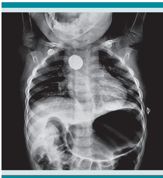
Figura 1. Radiografía de tórax anteroposterior en decúbito que evidencia un objeto radiopaco circular que se correlaciona con batería de botón a nivel torácico en el segundo estrechamiento fisiológico del esófago.

Se solicitó la valoración del cirujano pediatra y se inició un esquema con corticosteroide, antibiótico y nutrición parenteral durante 5 días. Se intervino para la extracción del objeto por medio de toracotomía posterolateral derecha, esofago-