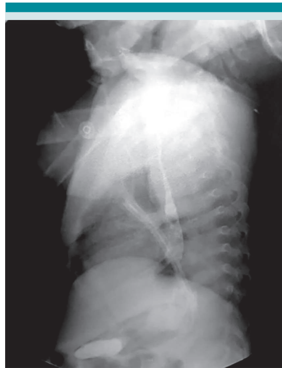
Figura 4. Estudio posquirúrgico con contraste hidrosoluble (esofagograma) que evidencia la permeabilidad de la luz esofágica.