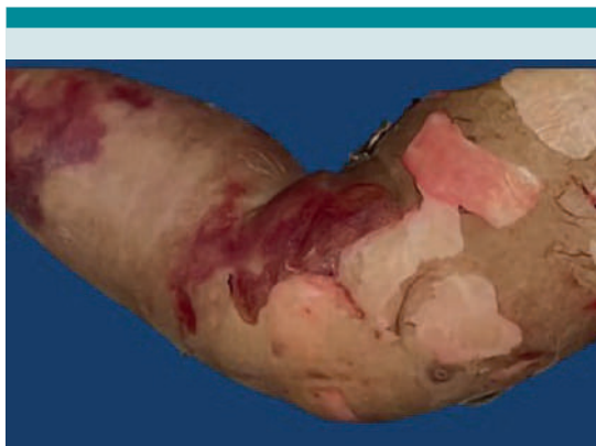
Figura 1. Lesiones cutáneas ampollosas en el miembro inferior izquierdo.