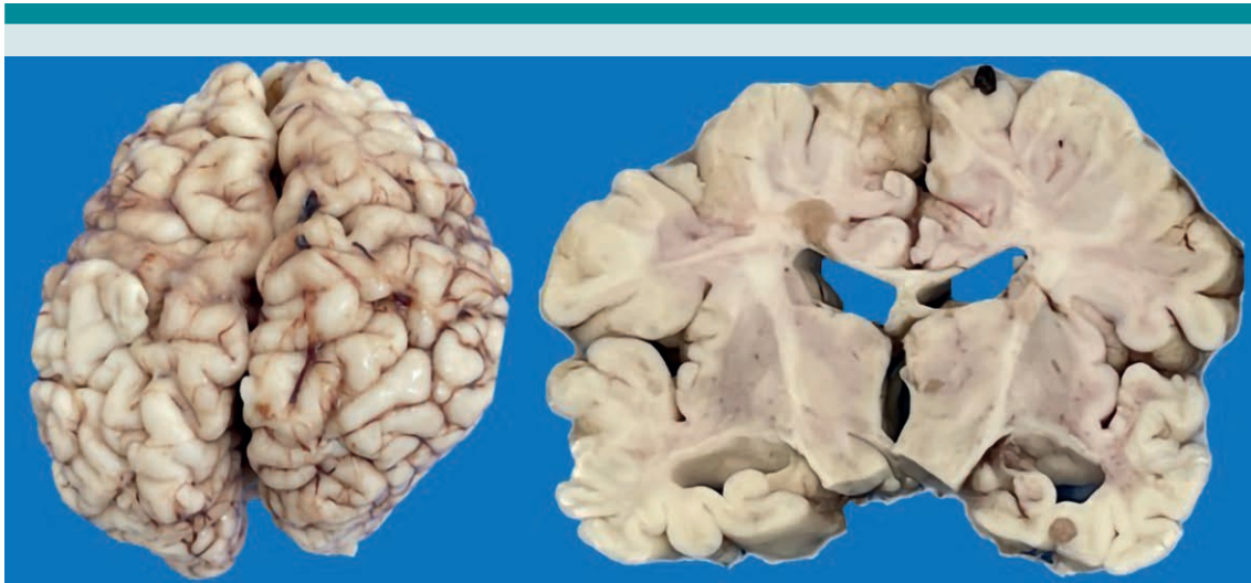
Figura 2. El cerebro evidencia circunvoluciones gruesas e irregulares, y surcos profundos. Al corte se observa dilatación del sistema ventricular.