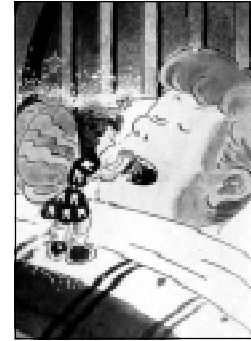
Figura 2. El hada de los dientes. (Romero, RCOE, 1998, Vol. 3, No. 6, Pág. 571).

En Inglaterra y los Estados Unidos de Norteamérica el trabajo del ratón Pérez lo realizan las hadas de los dien-