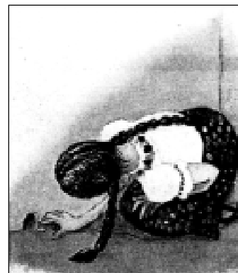
Figura 4. El diente al ratón. (Romero, RCOE, 1998, Vol. 3, No. 2, Fig. 5).

Cabe aclarar que en México el ratón de los dientes ha adquirido una gran popularidad entre los niños, porque representa ganancias económicas para ellos, ya que al preguntarles, pudimos constatar que la mayoría de los ratones cambian los dientes por dinero. Con el paso del tiempo ha aumentado la generosidad “ratonil” sin importar la devaluación, puesto que el rango del donativo