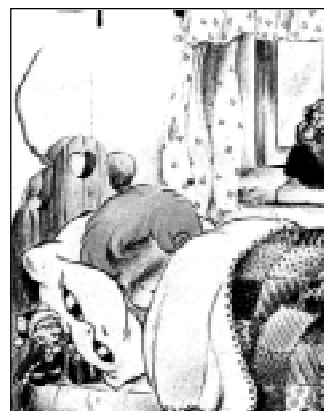
Figura 6. El regalo del ratón Pérez. (Romero, RCOE, 1998, Vol. 3, No. 2, fig. 6).

económico oscila entre $ 5.00 y $ 200.00, los cuales son totalmente libres de impuestos y su ganancia es neta para el niño, pudiendo de esta manera comprar desde un dulce hasta el juguete que había estado esperando.