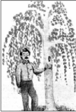
Figura 3. Diente en árbol. (Romero, RCOE, 1998, Vol. 3, No. 2, Fig. 2).

cuales no se desea la semejanza con su dentadura, como son el perro y la gallina, la cual no tiene dientes. En otros lugares se recomienda colocar el diente bajo la corteza de un árbol cercano a un río. Nada ocurrirá si la corteza crece sobre él o si se cae al agua, pero si se quedara a la intemperie y las hormigas corrieran sobre el diente, el niño sufriría alguna enfermedad bucal.