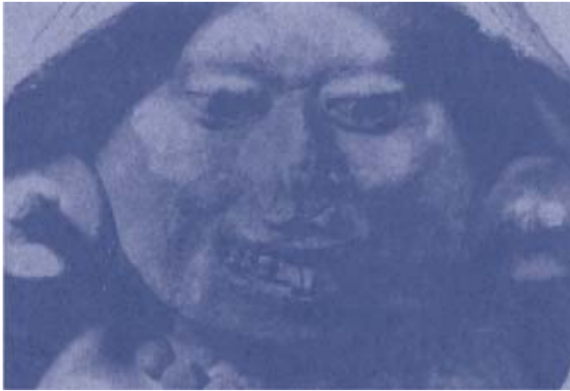
Figura 5. Procedencia: Acatlán de Pérez Figueroa, Oax. Museo Nacional de Antropología (Gutierre Tibon. Editorial Posada, México. 1975; pág. 113).

De Tlaxcala son las mujeres oradoras que vemos en la ilustración siguiente (Figura 9) las cuales se encuentran en el Museo Regional. Estas figurillas son una graciosa personificación de toda clase de mujeres ataviadas de las