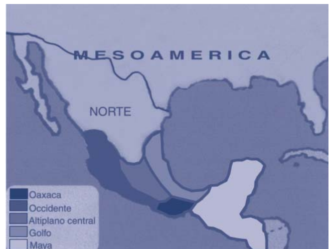
Figura 2. Culturas teotihuacanas, zapotecas, maya y del centro de Veracruz.

La investigación de las referencias documentales sobre el embellecimiento dentario en los restos humanos prehispánicos hizo posible indagar sobre las ilustraciones gráficas de piezas de cerámica y figurillas de barro como muestra de los hallazgos arqueológicos en los que es posible observar la reproducción graciosa de las diversas formas dentales deseadas, el limado y la perforación