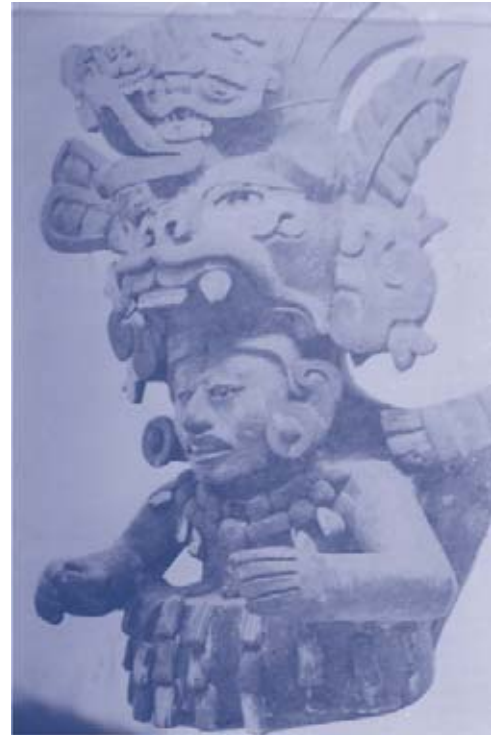
Figura 7. Pitao Cozobi. Cultura zapoteca. Museo Nacional de Antropología. (Romero J. INAH, México. 1958; pág. 189.)