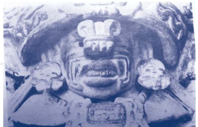
Figura 8. Urna de barro de la tumba 32 de Monte Albán, Oaxaca. Museo Nacional de Antropología. (Romero J. INAH. México. 1958; pág. 184.)