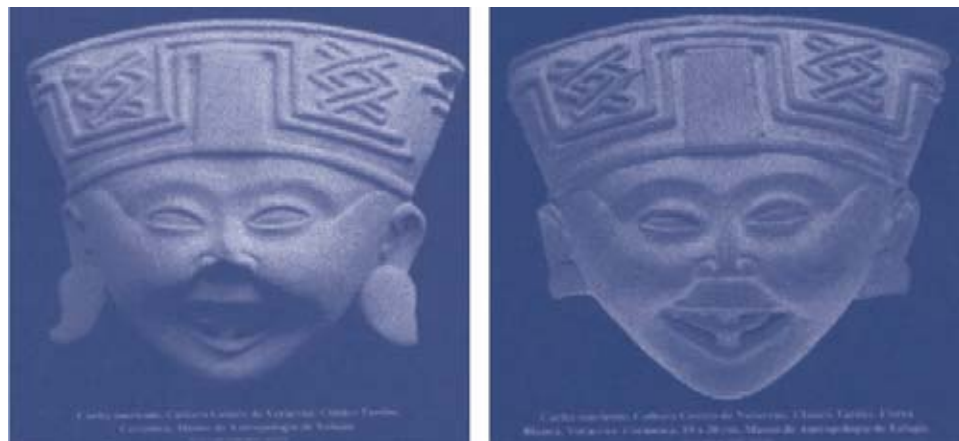
Figura 4. Carita sonriente. Cultura Centro de Veracruz. Museo de Antropología de Xalapa, Ver. (Revista: Arqueología Mexicana. Núm. 6 Especial. Pág. 42.)

riores que contribuye a la expresión de la alegría en la sonrisa (Figura 4).