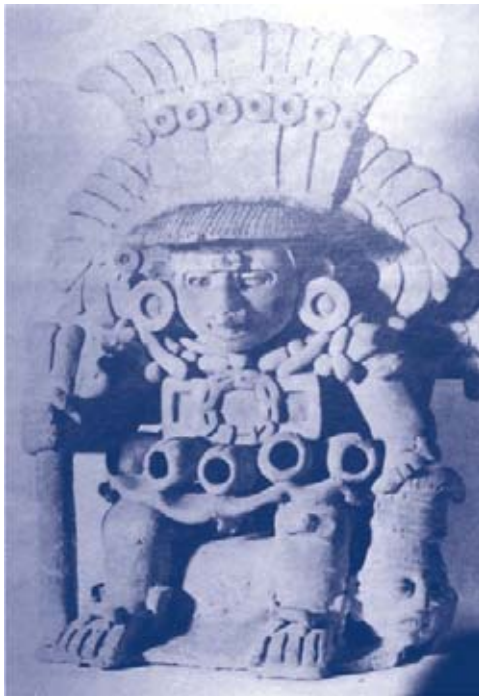
Figura 6. Urna de barro de la tumba 103 de Monte Albán, Oaxaca. (Romero J. INAH. México. 1958; pág. 182).