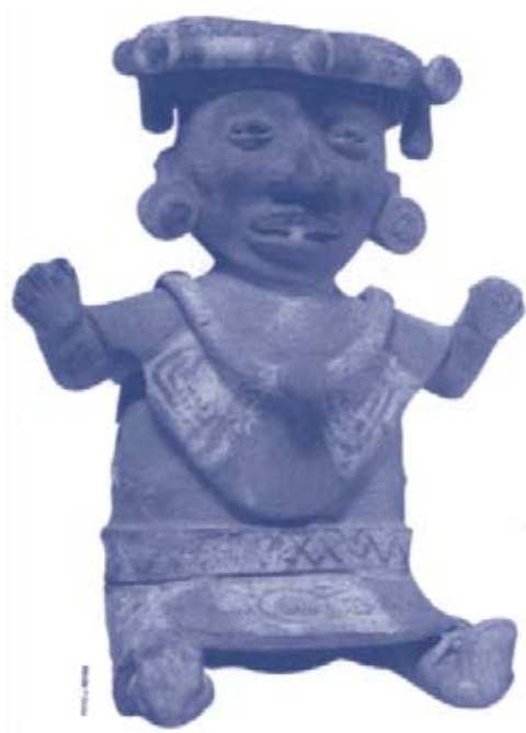
Figura 9. Esculturas modeladas en barro, Xochitecatl, Tlaxcala. (Revista Arqueología Mexicana. Vol. V. Núm. 29. Pág. 23.)

más diversas formas. En el rostro de los ejemplares se observa la boca siempre abierta con un gesto sonriente que muestra los dientes, lo que permite apreciar la limadura dentaria en forma de «T». 11