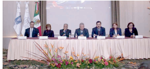
Presidium durante la Ceremonia de la 3ª Semana Nacional de la Certificación ADM.