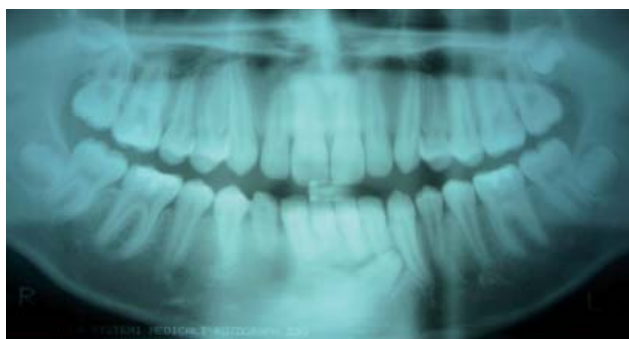
Figura 1. Panorámica dental mostrando al canino 43 oblicuo transmigrado en la sínfisis con su punta coronal dirigida hacia el área radicular del 32 y 33. Nótese la persistencia del canino deciduo 83.

Una retención dentaria, es aquel estado en el cual un diente parcial o totalmente desarrollado queda alojado en el interior de los maxilares después de haber pasado