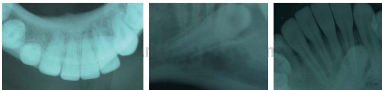
Figura 2. Radiografías oclusal y periapicales mostrando canino 43 transmigrado con su raíz completamente formada en posición vestibulo-oblicua apical a los órganos 42, 41, 31 y 32.