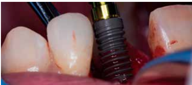
Figura 5. Colocación de implante BTI, conexión interna.

expresaba como motivo de consulta querer reponer ese diente de manera fija ( Figuras 1 y 2 ).