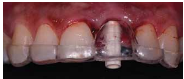
Figura 7. Colocación de cilindro provisional estético de órgano dentario 21.