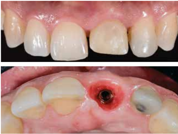
Figura 9. Fotografías control a los cuatro meses que muestran conformación de perfil de emergencia, se observa puntillito de cáscara de naranja en encía.