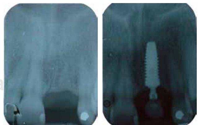
Figura 8. Radiografía inicial e inmediata a colocación de implante con provisional inmediato.