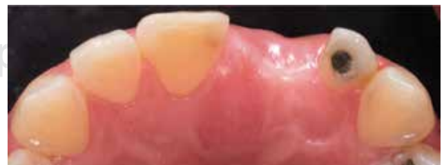
Figura 2. Ausencia de órgano dentario 21, vista incisal.