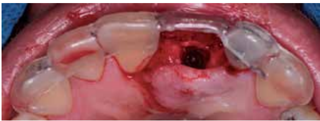
Figura 4. Guía tomográfica no restrictiva.