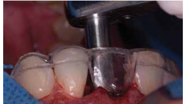
Figura 6. Torqueo de implante a 50 Newtons.

Se realizaron citas de control a la semana, a los 15 días y al mes. Cuatro meses después de la colocación de implante y provisional inmediato se retira el mismo ( Figura 9 ) para la toma de impresión a cucharilla abierta personalizada con Pattern Resin LS.