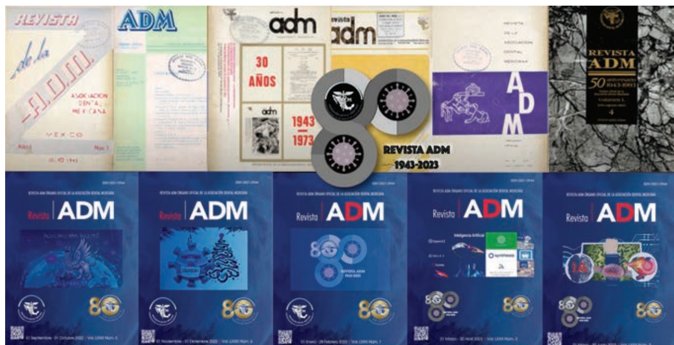
Figura 1: La portada de la Revista ADM ha tenido más de 75 grafismos, que en los 28 números de años recientes contiene diseños propios de la edición. Ésta es la portada del 80 Aniversario en el No. 4 (julio-agosto) Vol. LXXX 2023.

Aceptación y publicación: una vez que el artículo ha pasado por el proceso de revisión por pares y se ha realizado cualquier revisión necesaria, se toma una decisión final y, si es aceptado, se procede a una prueba fina para la publicación en la revista.