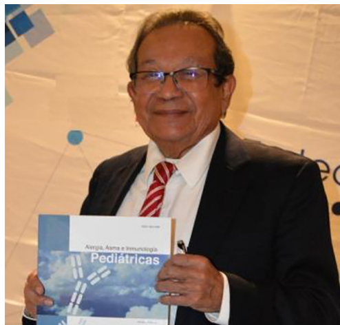
Figura 1: Dr. José Guadalupe Huerta López. Fundador de la revista de Alergia, Asma e Inmunología Pediátricas .

En el año 2001, gracias a la calidad científica de sus publicaciones y a la posibilidad de consultar artículos completos en PDF en el portal Medigraphic Litera-